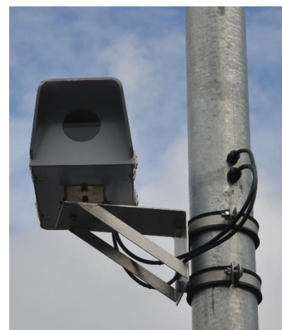
Mastkonsole mit Mastschellen